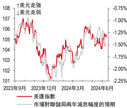
注：數據截至香港時間 2024 年 6 月 20 日 20:30。