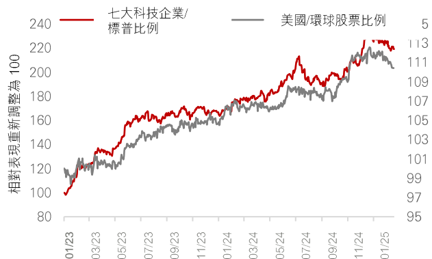
圖表 1：「七大科技企業」 拖累了美國股市年初至今的表現

資料來源：彭博、滙豐環球私人銀行及財富管理，截至 2025 年 2 月 22 日。預測可能會改變。過去的表现並非未來表现的可靠指標。